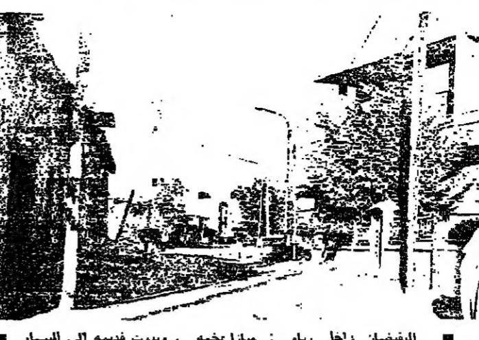
الصفحة داخل ريان : مازلخه .. وسدت نفسه الى السار

زحلة - من عبد الإستر : رفاق البلدة التي لها شهرة واسعة في جميع أنحاء اللبنانية ، لها شكاوى كثيرة ويبتدأ شهرتها وهي بلدة حبيبة في عورها .. وليس في شكلها اجالا ، فخارها يعود الى حوالي اثني عشر سنة . ولم يكن يتبع فيها سوى عائلات تفتقد بها آل الحاج شاهين وآل الهندي .